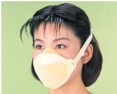
お手頃価格 簡易防塵マスク