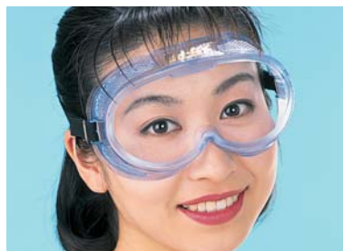
軽量で疲れない 作業メガネ