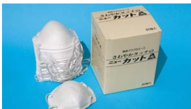
軽量でソフト 簡易防塵マスク