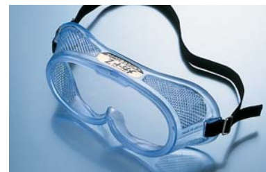
長時間くもらない くもり止め加工 作業メガネ