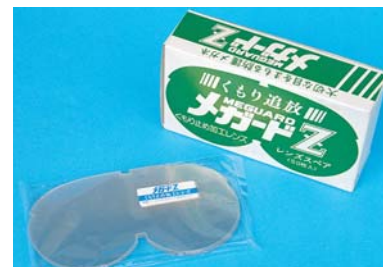
くもり止め加工 交換レンズ