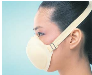
活性炭入り 活性炭入り 簡易防塵マスク