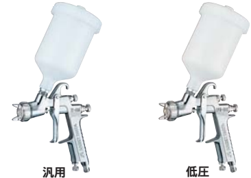
汎用 センターカップ スプレーガン W-400-142G 重力式 PCG-6P-M カップ取付例