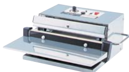
NL-250FH (フリーハンドタイプ)