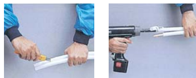
ベアチューブの作業例