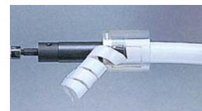
チップブレーカー機構