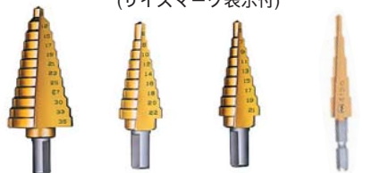
TK635G TK622G TK521G TK412G

チタンコーティングで軽快な切れ味。 ゴールドタイプ(コバルトハイス&チタンコーティング)