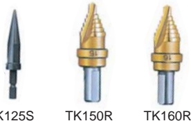
TK125S TK150R TK160R