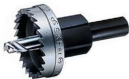
E型ホールカッター