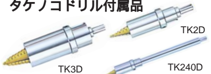
TK3D TK240D TK2D