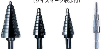
TK635 TK622 TK521 TK412