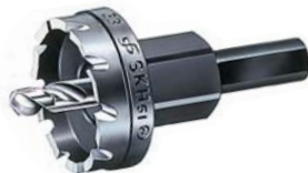
G型ホールカッター