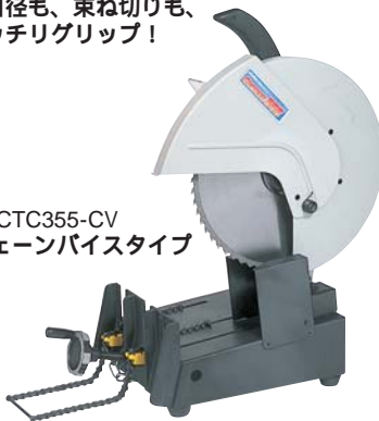
IS-CTC355-CV チェーンバイスタイプ