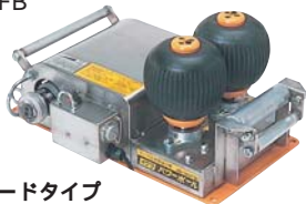
スタンダードタイプ