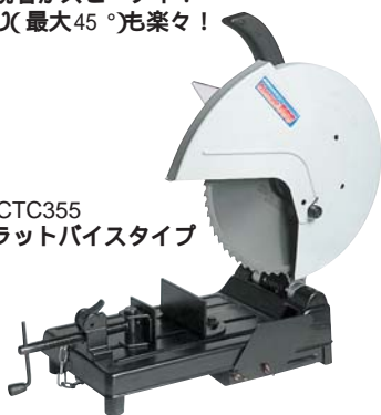
IS-CTC355 フラットバイスタイプ