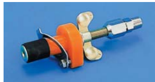
ポンプホース取付型