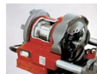
アサダ独自のボールベアリング採用