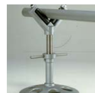
アストロニック1.5・2・3・4、 パイセットNo.6用