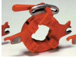
標準ダイヘッド (手動切り上げ)