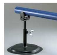
アストロニック1用