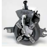
アストロニックダイヘッド (自動切り上げ)