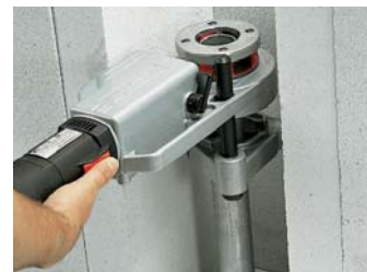
スーパートロニック