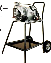
ロールグラーパー918