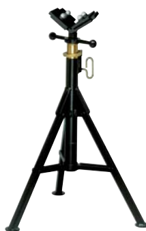
パイプジャックHボール