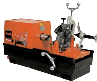
オートチャックねじ切り機