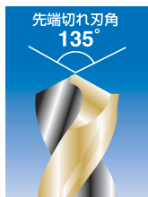
刃先は食い付きの良い クロスシンニング仕上げ

〔特長〕 ワンタッチチャックの充電ドリルで鉄工用ドリルが使用できます。 精密キャスティング技術でドリルと六角軸を一体成型、六角軸ドリル特有の芯ブレが、ほとんどありません。 従来品の3倍早く穴あけでき、3倍長寿命。 消費電力が少ないので、コードレスドリルでの使用に最適です。